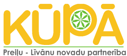
Jaunais “Preiļu – Līvānu novadu partnerības “Kūpā”” logo.

Tālāk tekstā “Preiļu – Līvānu novadu partnerība “Kūpā”” tiek minēta kā “Preiļu rajona partnerība” dokumenta sadaļās, kas attiecināmas uz VRG darbību līdz 2023.gadam.