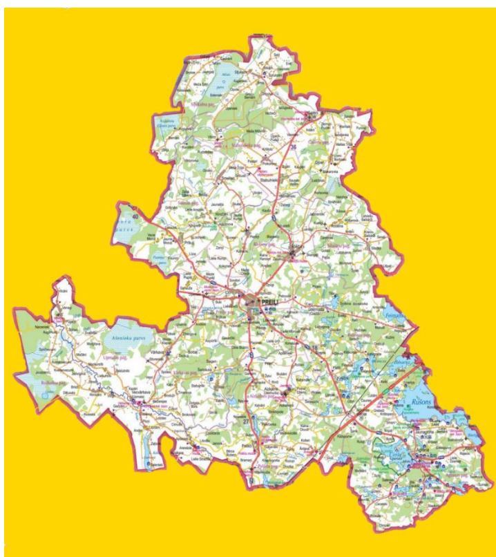
1.attēls. Preiļu - Līvānu novadu partnerības "Kūpā" darbības teritorija.

Līvānu novadā – Līvānu pilsēta, Jersikas pagasts, Rožupes pagasts, Rudzātu pagasts, Sutru pagasts un Turku pagasts.