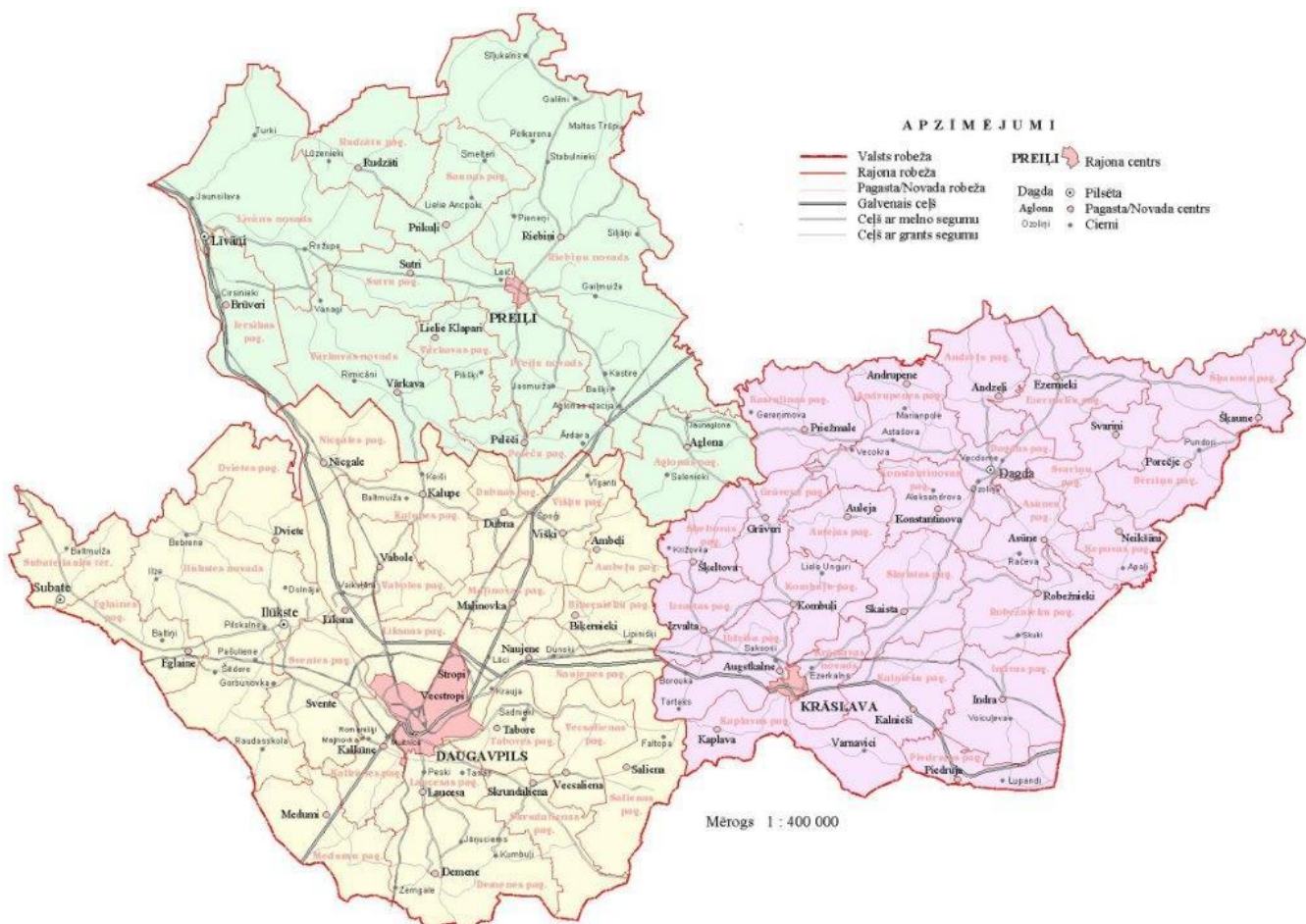
1.attēls. Dienvidlatgales vietējo rīcības grupu darbības teritorija.

Biedrības “Preiļu rajona partnerība” darbības vīzija – iedzīvotājiem ir pietiekošas darba, izglītības, dzīves un darba prasmju attīstības un sadarbības iespējas, kā arī katram vecumposmam atbilstošas daudzpusīgas pašizpaušmes iespējas. Iedzīvotāji ir informēti, aktīvi, radoši un uzņēmīgi. Viņu dzīvesveidu un darba stilu raksturo ģimenes vērtības, atvērta domāšana, drošumspēja, mīlestība un cieņa pret darbu un dabas vidi un sociāla atbildība vienam pret otru.